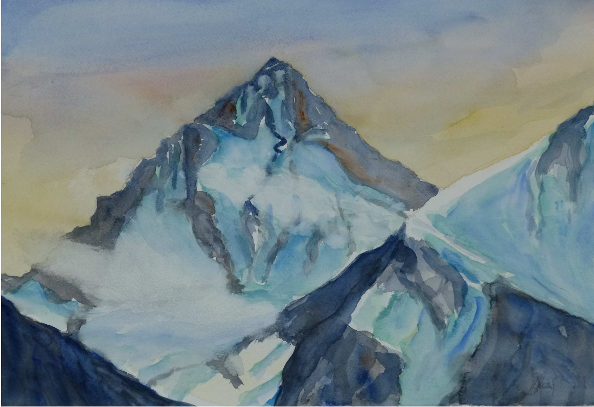
La Dent Blanche (coté Zinal)