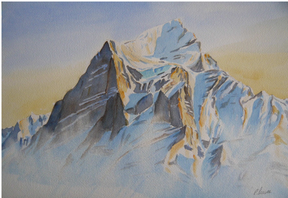
Wetterhorn (Blick von oberhalb Grindelwald)